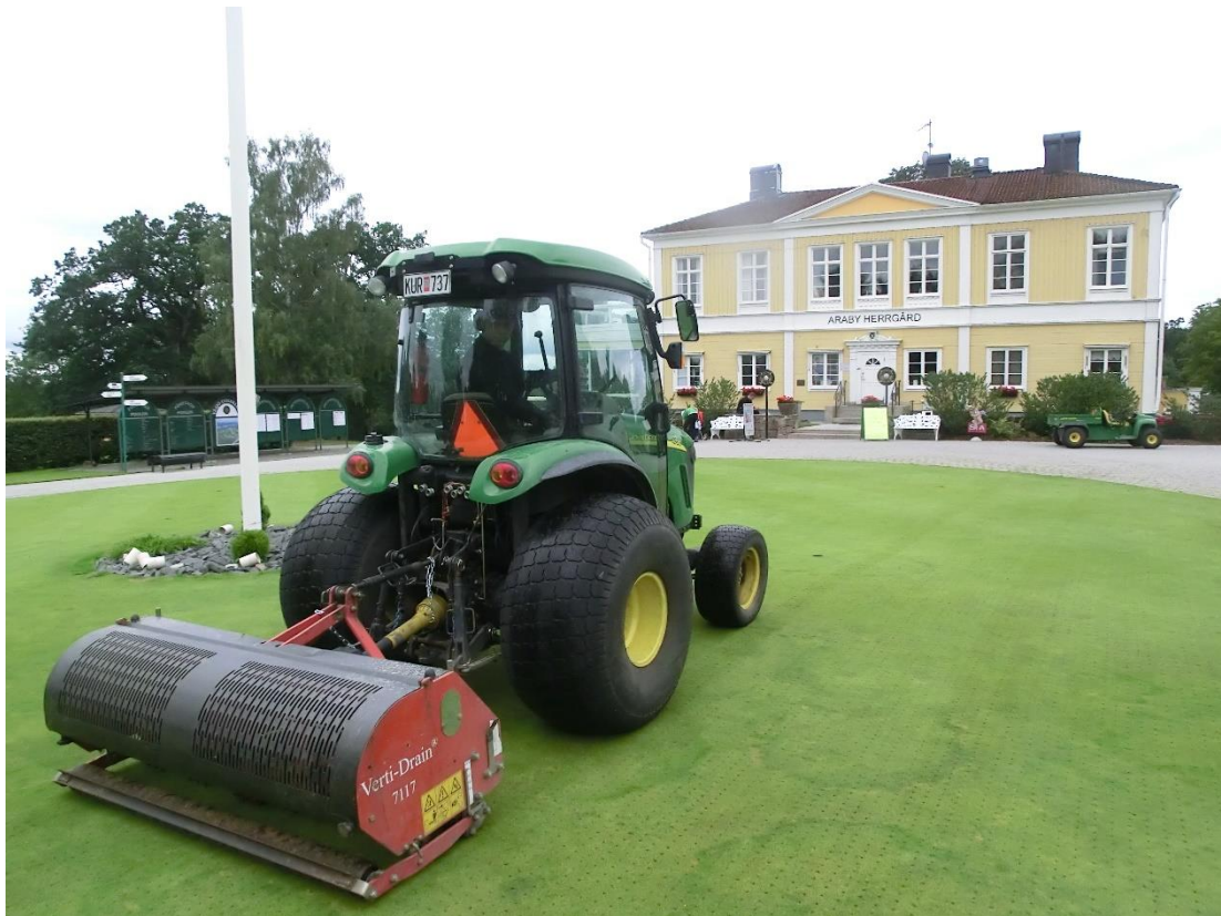
Bild Verti Drain luftning av Putting green på Växjö GK