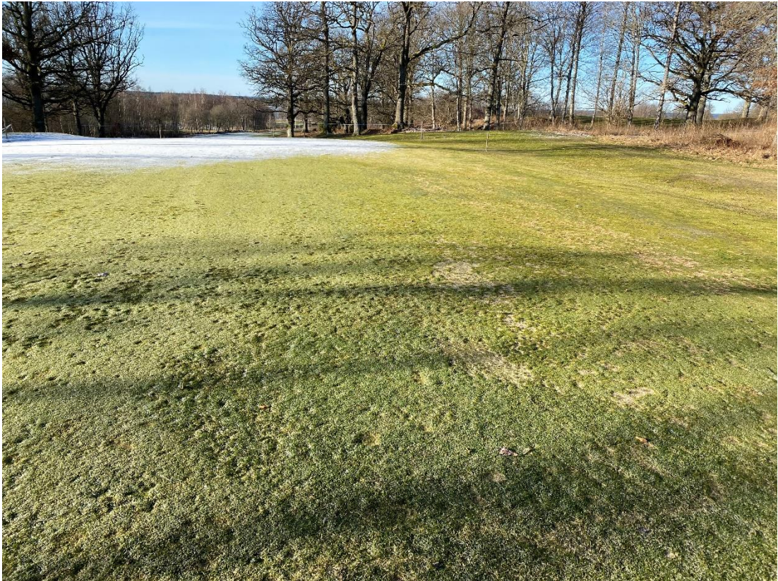
Bild green 13 Värnamo GK

Det är ingen som helst tvekan om att era greener blivit ganska hårt angripna av Snömögel ( Microdocium Nivale )